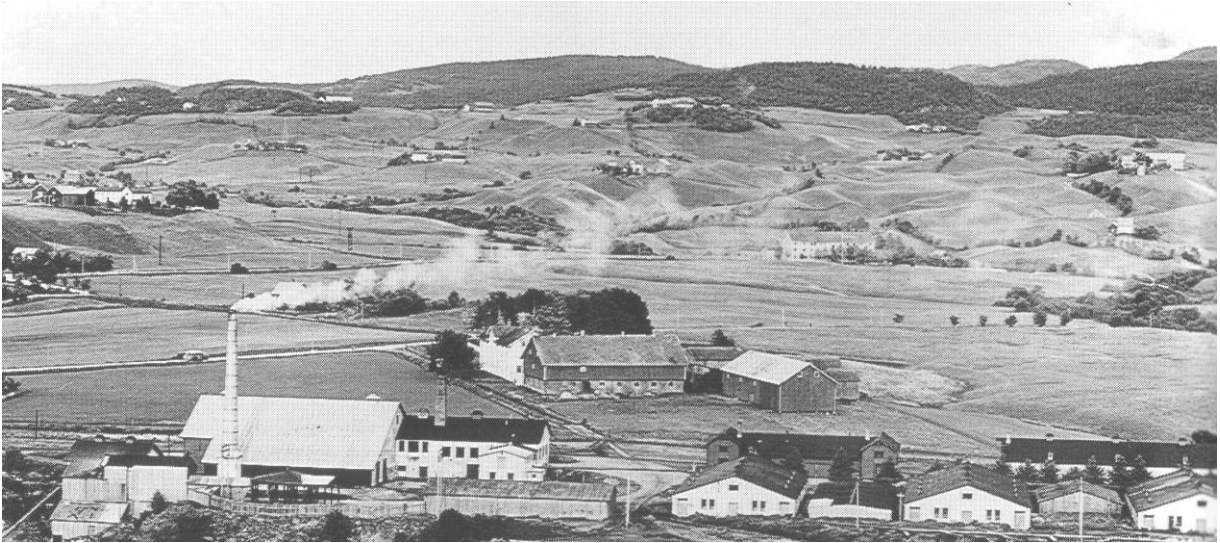
Sluppen gård ca 1935

Sluppen i Strinda var en meget gammel gård. Den var et av de eldste gårdsbruk i bygden og den var lenge også en av de største gårdene i prestegjeldet.