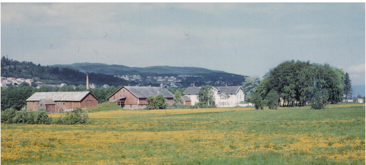
Sluppen gård 1962